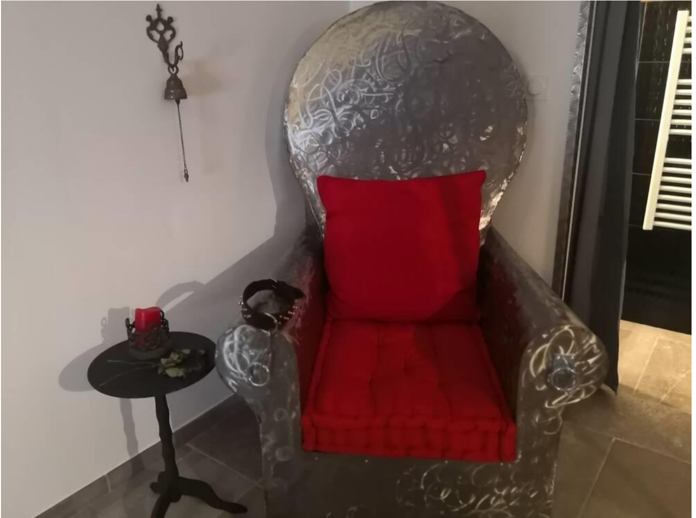
Fauteuil particulier et sa sonnette

Ce concept unique n'est pas sans faire parler. Aux alentours on chuchote, on médite, on accuse... Frédéric et Estelle déplorent cet état de fait. "On ne pourra jamais empêcher ceux qui ne sont jamais venus de se faire des idées... Notre concept est unique et innovant, c'est normal qu'il fasse parler," affirme Estelle. Elle développe : "nos clients signent une charte qui stipule en substance que chacun est libre de ses actes dans l'intimité de sa chambre et seulement là."