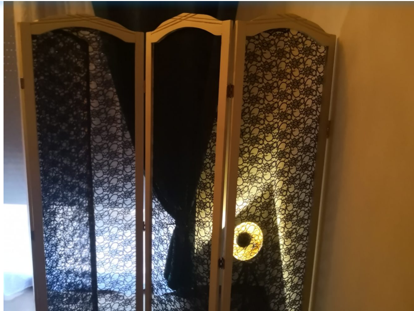
Paravent en dentelle, invitation au strip tease

On retiendra Poésie d'Amore , pour son ambiance vénitienne raffinée : masques sur les oreillers, lit à eau kingsize chauffant et massant, son incroyable douche et son paravent en dentelles pour strip-tease suggéré. Autre ambiance, Bienvenue à Sin City nous transporte dans un Las Vegas fantasmé, lit rond, machine à sous, cartes et jetons, barre de pool dance, déguisements et un cheval à bascule pour le fun . Margarita bonita room est un délice de sophistication. L'incroyable lit à mouvement se partage la vedette avec une méridienne géante (et son mode d'emploi) et une baignoire ronde comme une invitation ... Quand nous visitons Alice et compagnie la chambre est en travaux mais promet déjà une évasion totale dans l'univers déjanté de Lewis Caroll.