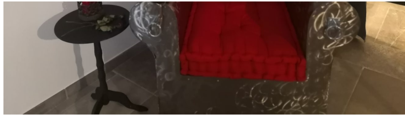
Fauteuil particulier et sa sonnette