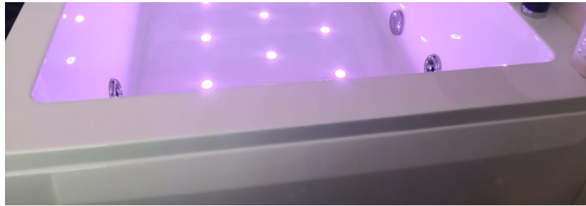
Mieux qu'un spa

Un travail de fourmi pour les tourtereaux qui ne veulent négliger aucun détail et qui ont bien l'intention d'aller jusqu'au bout du concept. "Nous voulions du haut de gamme, explique Stéphanie, tout doit être soigné dans le moindre détail et rien ne doit rappeler le quotidien."