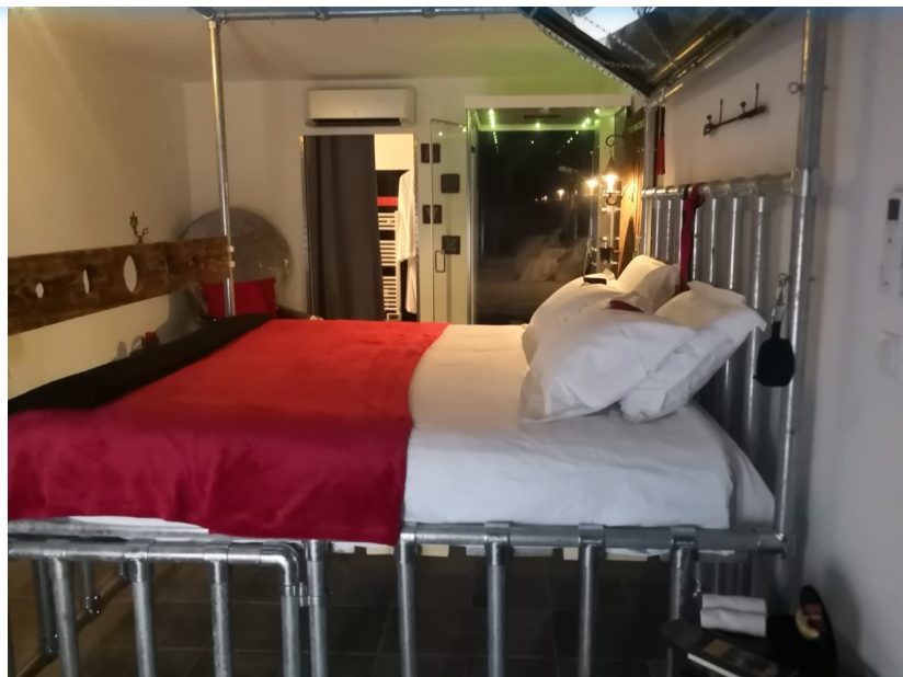
Un lit sur mesure et un décor had hoc pour se laisser aller à la domination