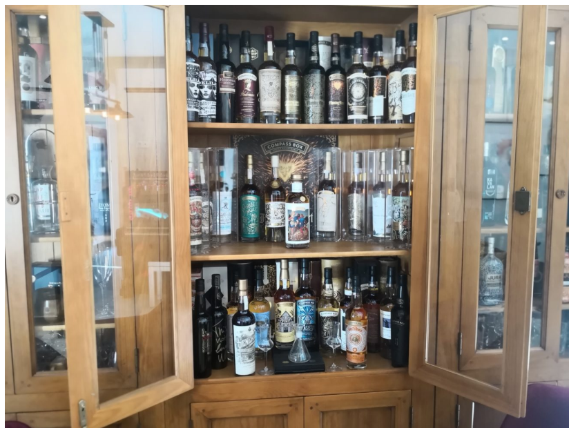
Incroyable collection...