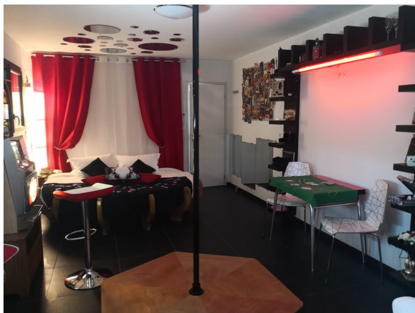
Bienvenue dans l'enfer du jeu, de la pool dance et des nuits de Vegas

Puis le moment tant attendu arrive, celui de la visite des chambres. Chacune tient ses promesses et, partout, le haut de gamme est au rendez-vous. Ni pathos, ni vulgarité. On baigne dans un univers luxueux, fortement teinté d'érotisme et d'une pointe d'humour. Les ambiances sont radicalement différentes et correspondent parfaitement aux rêves de décors érotiques pour nuits ludiques du commun des mortels.