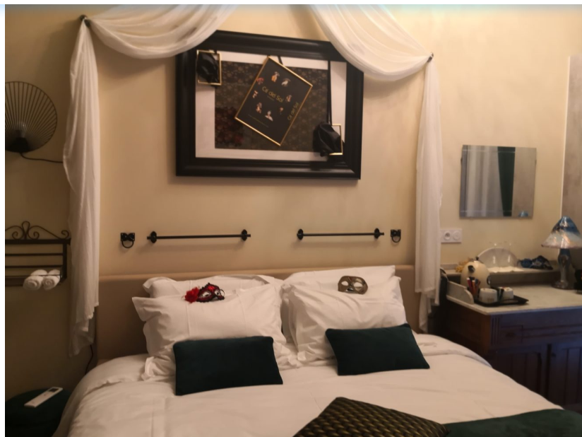
Voyage à Venise, lit à eau massant, et douche à effet de pluie en plus

À Gallargues-le-Montueux vient d'ouvrir une maison d'hôte d'un genre unique. Elle permet de prendre du temps pour soi tout en pimentant sa vie de couple. Ce décor calculé au millimètre - pour procurer une évasion totale - offre un terrain de jeu haut de gamme aux couples qui veulent échapper au quotidien et rebooster leur vie intime.